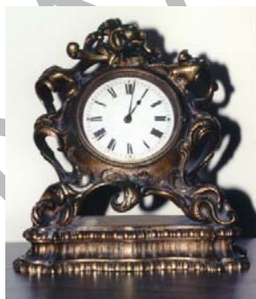
1. ábra Római számok 1

A számok írására ismerjük a római és arab számjegyeket. A római számok használata jóval ritkább, mint az arab számoké. Következésképpen csak néhány hagyományos esetben alkalmazunk római számokat: dinasztiai, évszázadok, események, rendezvények, címzésben a kerületek, emelletek, valamint törvények, fejezetek stb. sorszámainak megjelölésére: II. Endre, XX. század, II. világháború, XV. országos táncbéli napok, XXVI. fejezet, Budapest VIII. kerület, Baross u. 53. IV. emelet, a 2004. évi CXL. törvény a közigazgatási hatósági eljárás és szolgáltatás általános szabályairól .