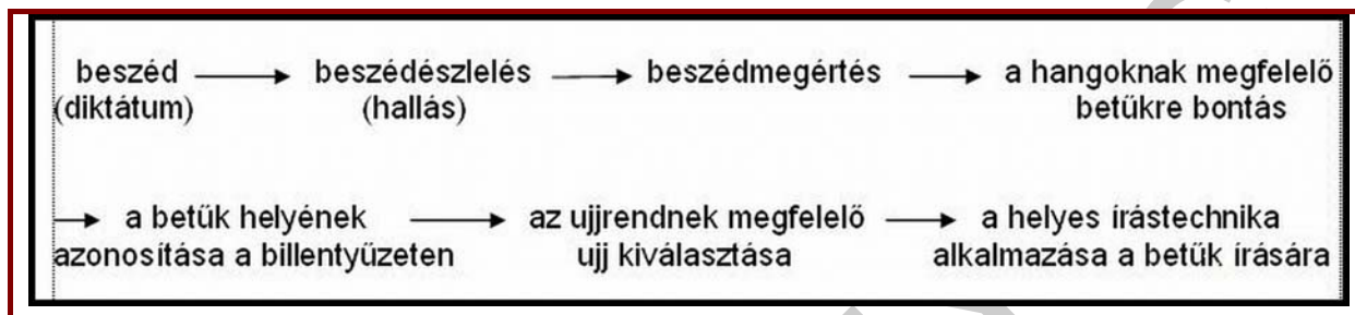
3. ábra. A beszédmegértés és rögzítés folyamata

A gépiró írastevékenysége azon alapul, hogy mint hallgató képes felépíteni a beszélő (diktáló) által elmondott beszéd nyelvi egységeinek (szavaknak, szó szerkezeteknek, mondatoknak stb.) azokat a sorozatait, amelyek a beszélő agyában megelőzően formát öltöttek. Ennek folyamán a nyelvi üzenet a hallószerven át eljut az agyba (a modern fiziológia azt is megállapítja, hogy az agynak melyek azok a területei, amelyekre a beszéd hat), majd eljut a gépiró a teljes felismerésnek azon fokára, amelyet megértésnek nevezünk. Csak ezután alakul ki az agysejteken az a mozgáskoordináción alapuló felismerés, amely "parancsot" ad az ujjaknak a beszéd egyes elemeire való lebontására, amellyel végeredményben a gépiró rögzíteni tudja a beszédet (diktátumot).