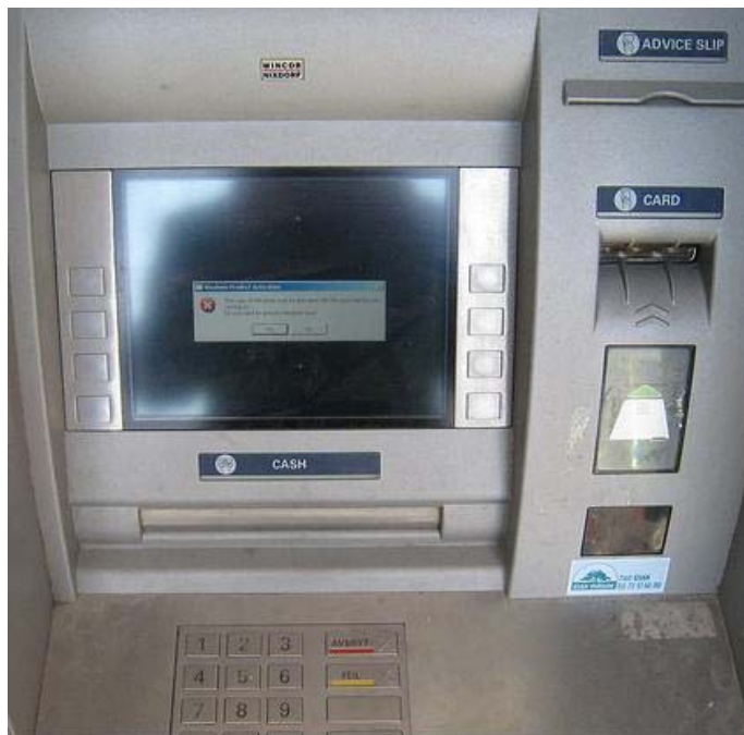
ATM bankjegykiadó automata

Amikor vásárlásra használjuk a kártyát, ezzel felhatalmazzuk a kártyánkat kibocsátó bankot, hogy a vásárlás összegével megterhelje a bankszámlánkat és juttassa el a kereskedőnek (természetesen a kereskedő bankján keresztül). A kártyaelfogadás mögött valójában még egy szerződés van. Előzetesen ugyanis a kártya kibocsátója és az azt elfogadó hely, például egy supermarket, vendéglő, szálloda kötnek egymással szerződést a kártya elfogadásáról. Ha egy üzlet kirakatában, ajtaján vagy pénztáránál megtaláljuk a kártyánkon található kártyatársaság védjegyét, akkor fizethetünk vele. Ugyanez igaz a bankjegykiadó automatákra is.