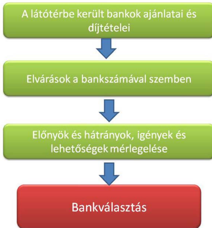
9. ábra. A bankválasztás lépései

A sok, első ránézésre igen hasonló ajánlatból az előzetesen összegyűjtött szempontok szerint, vagy érzelmi alapon kell választani. Gyűjtse össze, melyek lehetnek ezek?