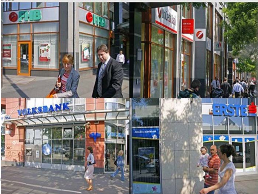
1. ábra. Melyik bank szolgáltatásait vegyük igénybe?

Piacgazdaságban a pénz központi szerepet játszik. A mai pénznek nincs belső értéke, de rendelkezik a pénz lényeges tulajdonságaival, azaz megfelel az értékmérő, forgalmi eszköz, fizető- és felhalmozási (kincsképző) eszköz, esetleg a nemzetközi pénz feladatának betöltésére. Két megjelenési formáját különböztetjük meg: bankszámlapénz és készpénz (ez utóbbi bankjegy és érme). A modern pénz számlapénz formában jön létre, de ha szükséges, akkor készpénzre átváltható, konvertálható. Ez történik például akkor, ha számlánkról bankfiókban vagy bankjegykiadó automatából készpénzt veszünk fel. Ekkor a forgalomban lévő pénz mennyisége nem változik, csak egy része „formát vált”.