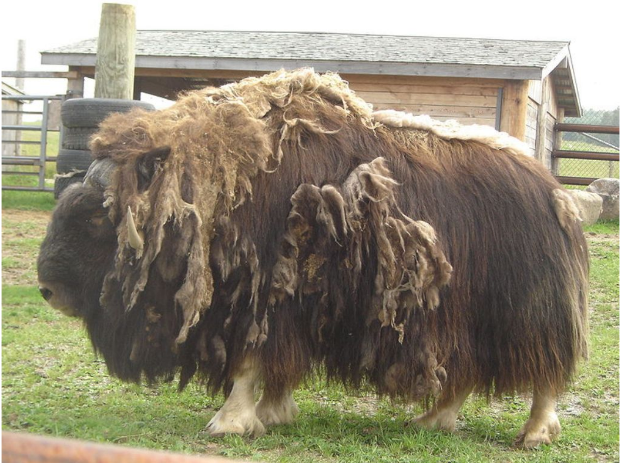
2. ábra. Pézsmatulok

A szarvasmarhafélék hím egyedét bikának, a heréltet fiatal hím egyedét tinónak, a későbbiben pedig ökörnek nevezik. A nőtényt szarvasmarhát tehénnek, a még nem ellett nőtényt üszőnek, a nem ivarérett fiatal állatot pedig borjúnak hívják.