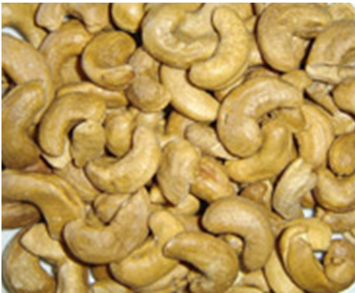
9. ábra. Kesudió

A 8. Árucsoport Kiegészítő Megjegyzés (2) bekezdése felsorolja azokat a termékeket, amelyeket a Vámtarifa „trópusi gyümölcs”-nek minősít az osztályozás során. Pl.: tamarind, papaya, karambola, mangó, licsi...stb.