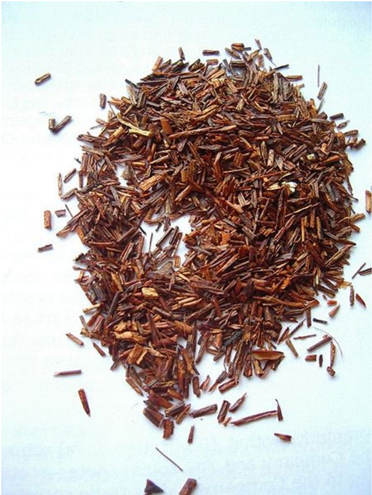
13. ábra. Vörös tea