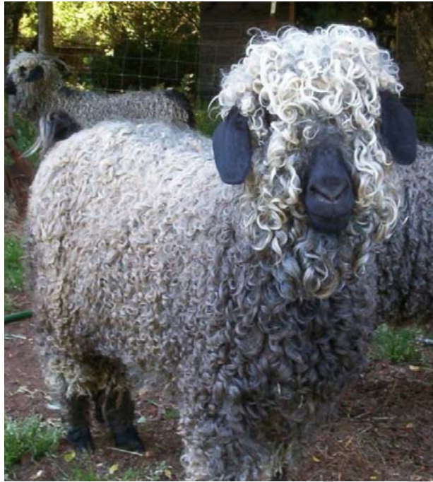
5. ábra. Angóra kecske