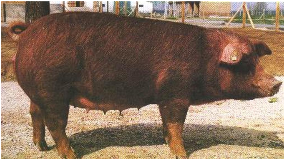
3. ábra. Duroc sertés