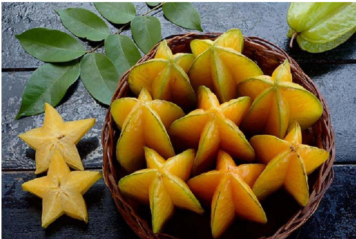
8. ábra. Karambola

A fentiekben felsorolt megmunkáláson túlmenően elkészített gyümölcsöket, diókat a 20. Árucsoportba osztályozzuk. Pl.: drénezett, kandírozott gyümölcsök (2006 vtsz.).