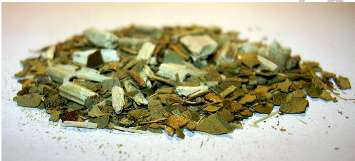
14. ábra. Matétea

A 0903 vtsz. alá osztályozzuk a matétea t. A matétea a maté fa (Argentínában, Uruguayban és Brazíliában honos cserje) megszáritott leveleiből készült főzet. A matétea teaszerű, koffeinben és antioxidánsokban gazdag főzet.