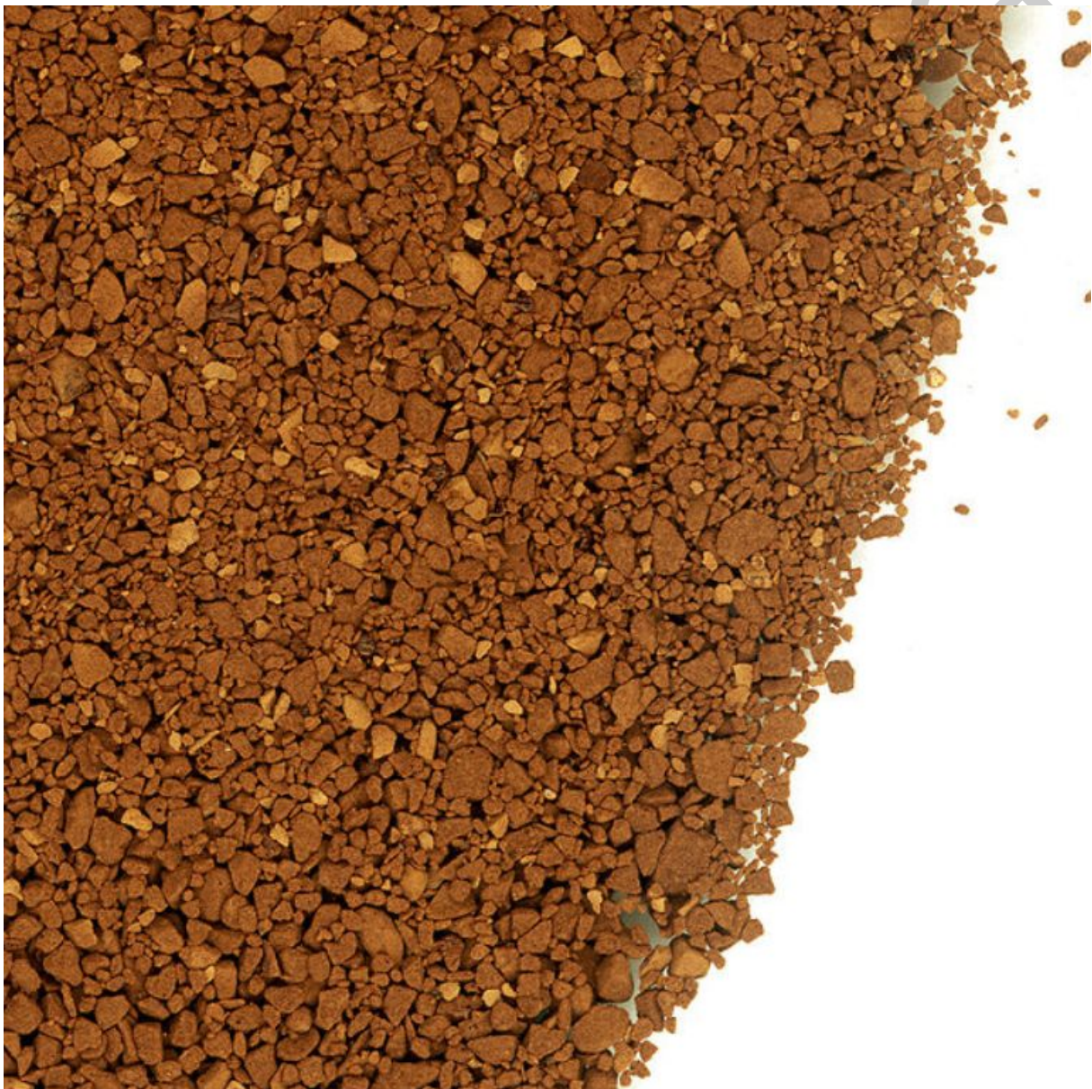
11. ábra. Instant kávé

Olyan készítmények, amelyek a pörkölt szemes kávé vízben oldható vonadéktartalmát tartalmazzák. Porszerű termékek, amelyek vízben gyorsan és maradék nélkül oldódnak. Így forró vízzel közvetlenül, az eredeti kávéval azonos élvezeti értékű kávéital készíthető belőlük. A kávészemekből pörkölés után gőzzel és meleg vízzel kivonják az oldható anyagokat. A kávé ízesítőanyagait még a vízgőzös kezelés előtt kivonják és félreteszik. Az oldatot betöményítik, majd fagyaszttva szárítják (Liofilezés). Mielőtt a kávé – oxigénmentes, nitrogén vagy szén-dioxidos környezetben – becsomagolnák, az ízesítőanyagokat újra a kávéhoz adják. Leggyakrabban a szárítással készített kávékivonatokkal találkozhatunk.2 Légmentes üvegedényben, vagy dobozban forgalmazzák. Pl.: Nescafé, Instant kávé.