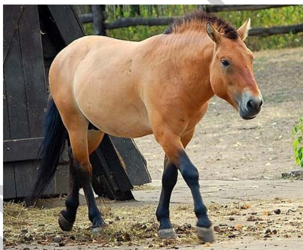
1. ábra. Przewalski ló

Ezen vámtarifaszám alá osztályozzuk a az élő lovat (beleértve a mént, kancát, csikót és pónit egyaránt), továbbá ide tartozik a szamár, a ló öszvér (muli) és a szamáröszvér. Ezen élő állatok házi és vad fajtái egyaránt ide kerülnek osztályozásra. A vadlovak közül ide osztályozzuk többek között a mongol lovat, a musztángot, a Przewalski lovat. Azonban a zebrákat – függetlenül attól, hogy a lófélék családjába tartoznak – a 0106 vámtarifaszám alá osztályozzuk.