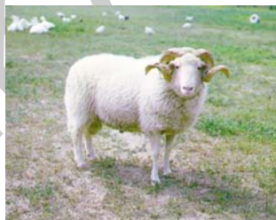
4. ábra. Cikta

Ez alá a vámtarifaszám alá osztályozzuk a különböző juh (kos, jerke, bárány) házi és vadfajait egyaránt. Pl.: argali, arkal, bábolnai tetra, bergschaf, cigája, cikta, gyimesi racka, vadjuh, merinó, muflon, romney, suffolk, tajvani széró, texel.