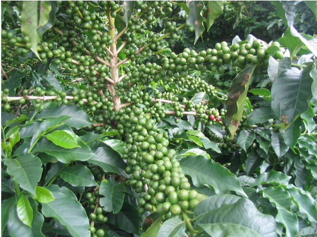
10. ábra. Kávécszerje

Pl.: 20% valódi kávé és 80% cikóriakávé keveréke.