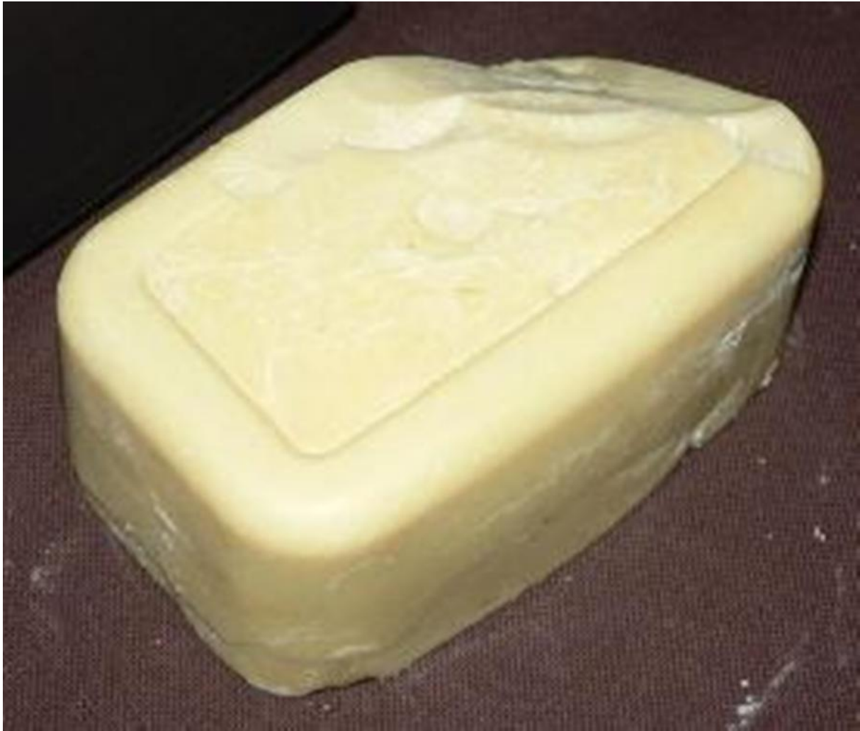
16. ábra. Kakaóvaj