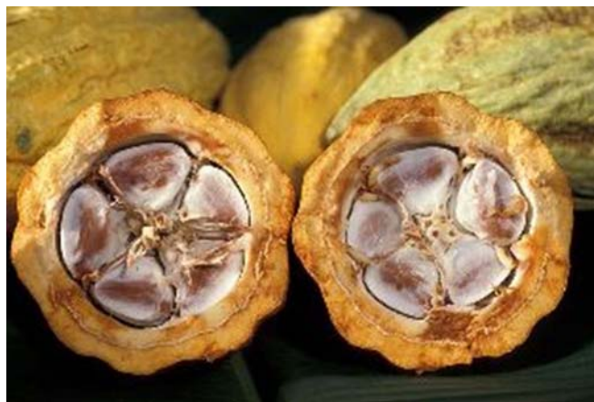
15. ábra. Kakaóbab