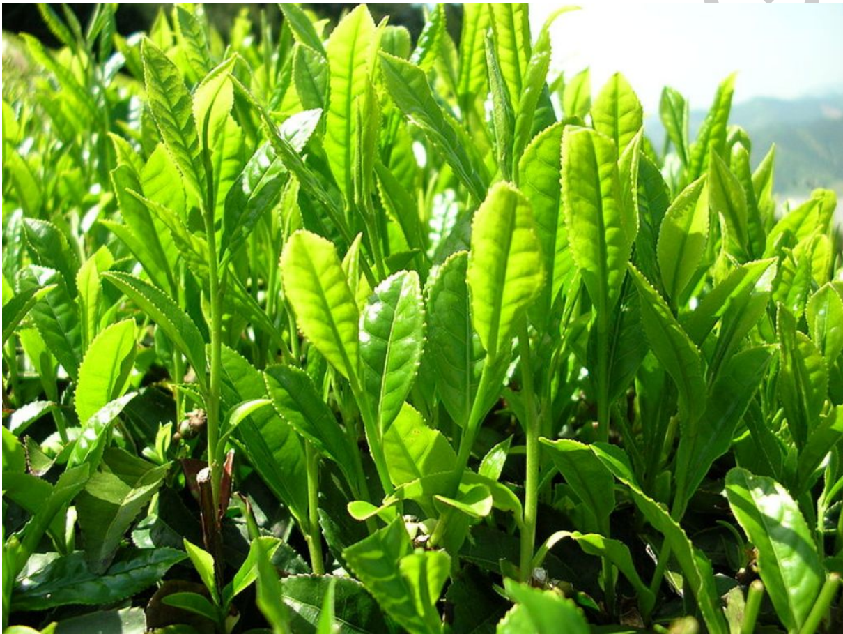
12. ábra. Zöld tea

A 0902 vámtarifaszám alá kizárólag a Thea (Camellia) nemzetségbe tartozó növényekből (levél, hajtás, bimbó, virág) nyerhető teák osztályozhatóak, amelyek alkalmasak arra, hogy belőlük ital vagy főzet legyen készíthető.