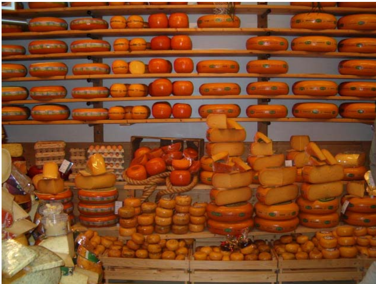
13. ábra: Sajtbolt Hollandiában