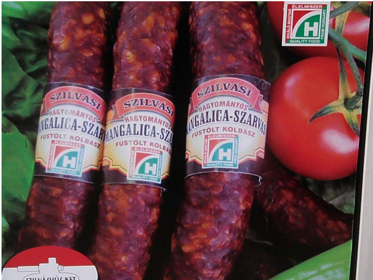
3. ábra: Kiváló Magyar Élelmiszer védjegy

A független megkülönböztető minőségtanúsítás akkreditált laboratórium vizsgálata alapján kiadott hiteles tanúsítvány, amely igazolja, hogy a vizsgált termék megfelel a kiíró szervezet által meghatározott előírásoknak, a pályázati feltételeknek, ezáltal a termék minősége meghaladja a többi, hasonló rendeltetésű termék minőségét.