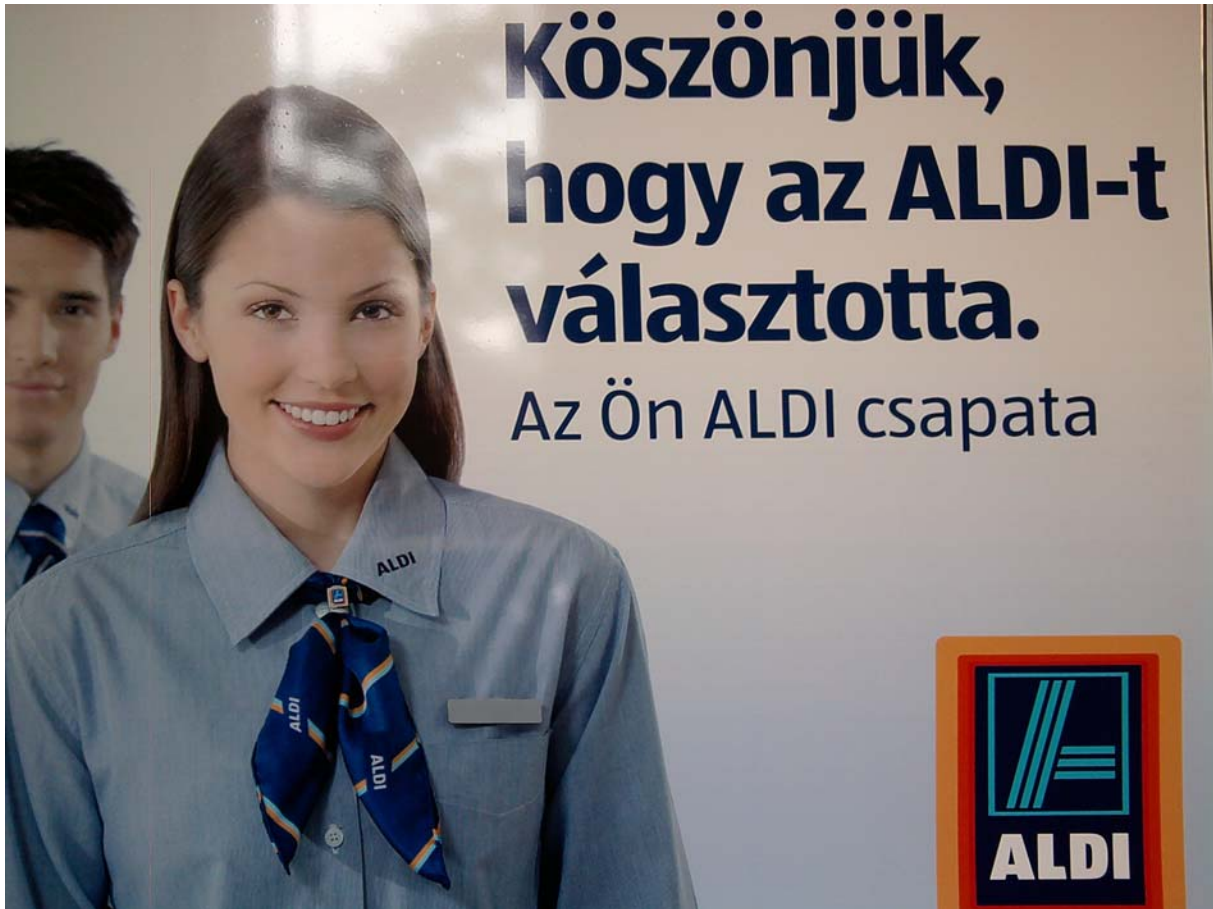
2. ábra: Egy ALDI áruház bejárata

Ön szerint miért tartják fontosnak a kereskedelmi láncok az ilyen tartalmú vásárlói tájékoztatók közzétételét?