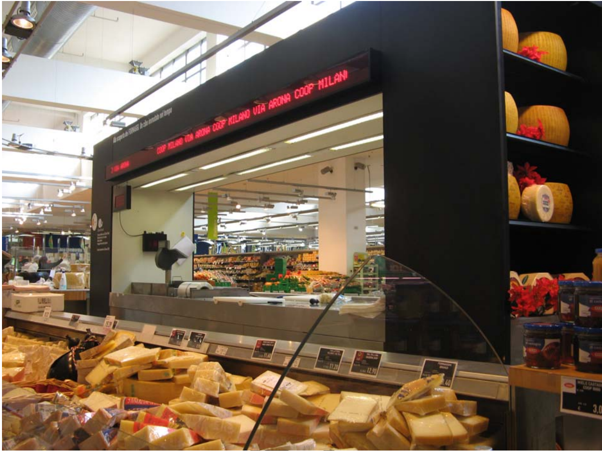
9. ábra: Sajtpult Olaszországban