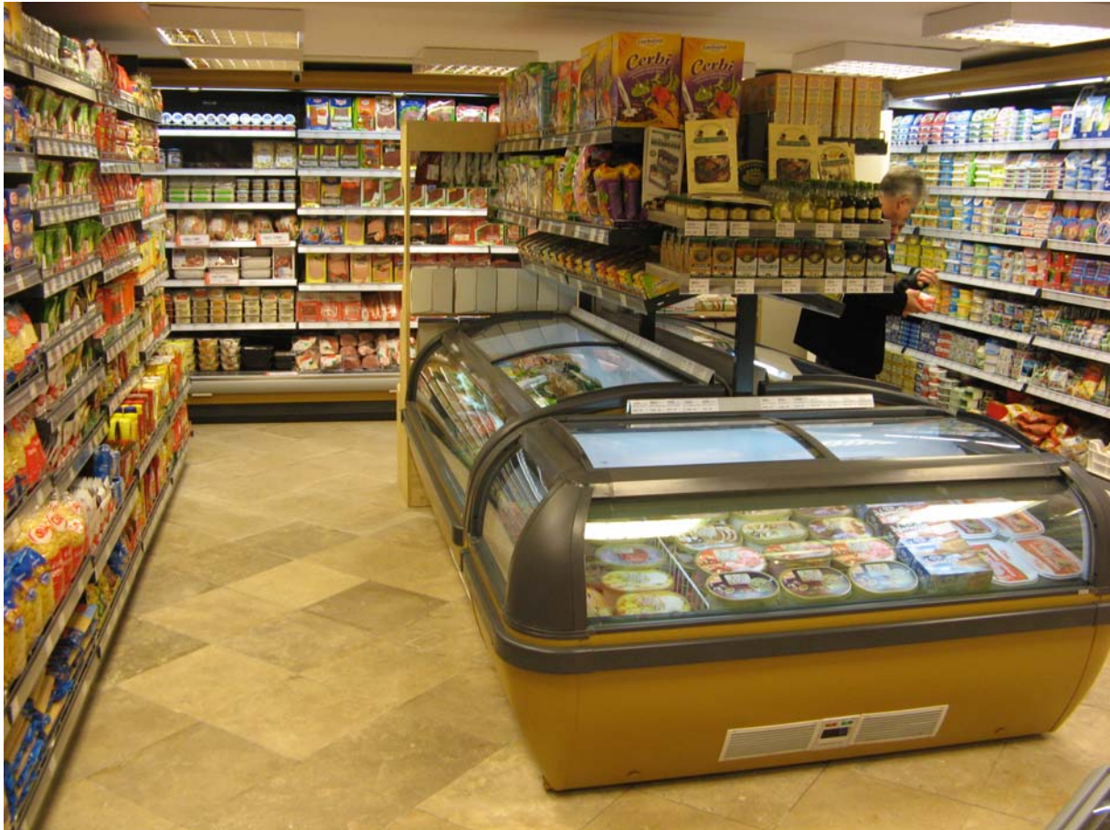
5. ábra: Fagyasztópultban és hűtőpultban tárolt élelmiszerek szakosított tárolása