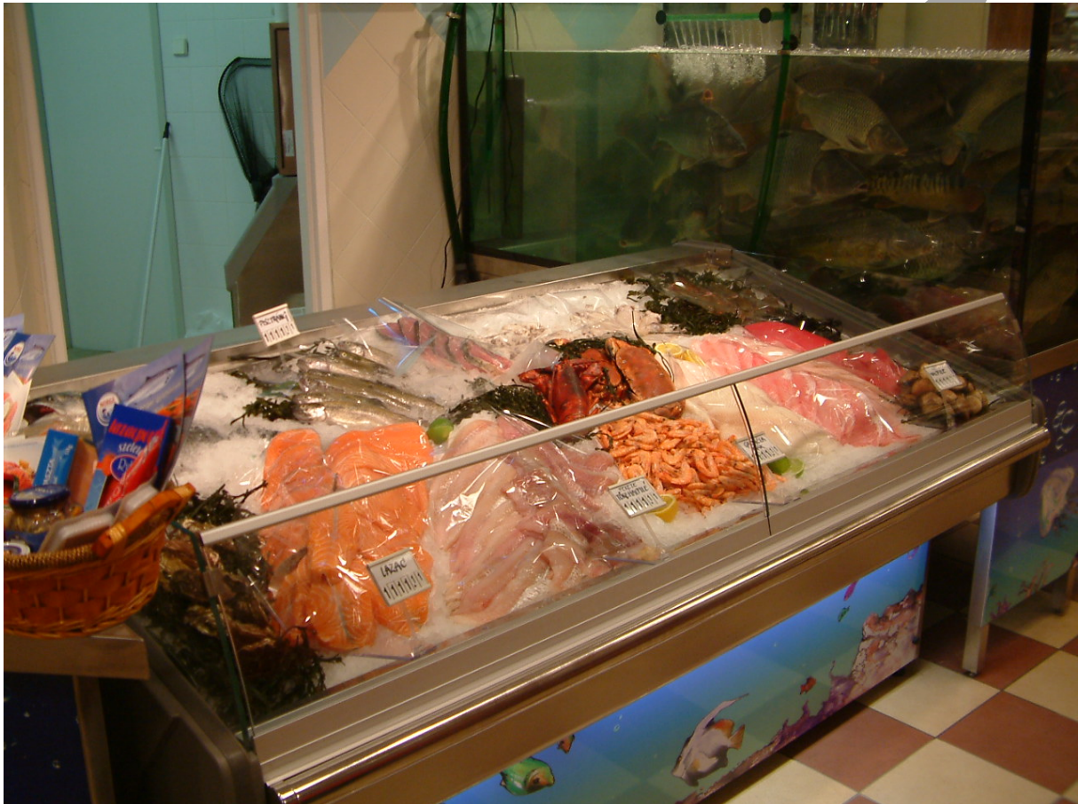
7. ábra: Halak árusítása jégen valamint élőhal-árusítás levegőztetett medencében

Valamennyi előkészítési műveletet és az élelmiszerek kereskedelmi forgalmazását elősegítő csomagolását is a szakosítás szabályainak szigorú betartása mellett kell végezni. Nyers húst, baromfit, halat, zöldséget-gyümölcsöt, fogyasztásra kész élelmiszert nem szabad azonos helyen előkészíteni, előrecsomagolni. A különböző higiéniai megítélésű élelmiszerek előkészítéséhez, darabolásához szeleteléséhez használatos edényeket, eszközöket a rendeltetésüknek megfelelően kell jelölni és használni, elmosogatni és tárolni. Mindegyik helyen külön mosogatót kell felszerelni.