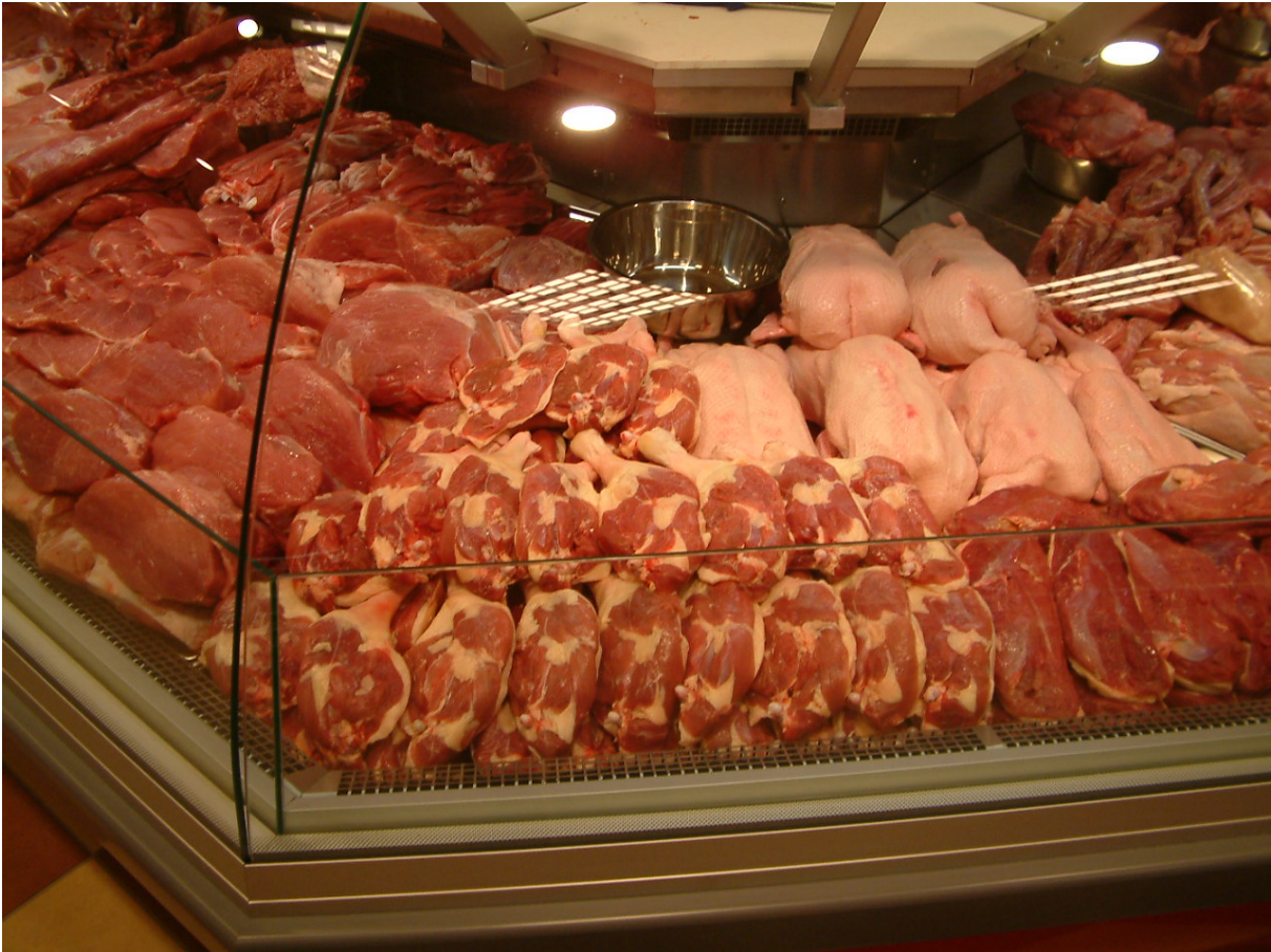
14. ábra: Hentespult