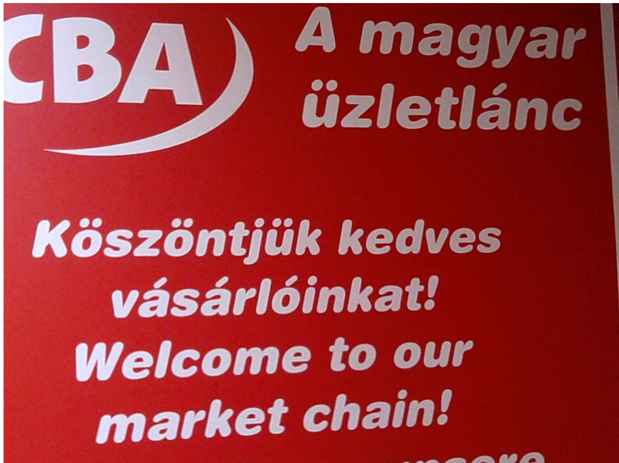
1. ábra: Egy CBA áruház bejárata