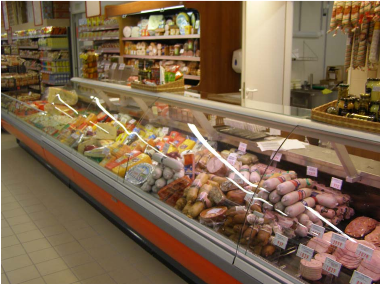
4. ábra: A sajtok és a húsfeldolgozó-ipari termékek külön pultban

Összesítve az élelmiszerbe kerülésük módjait: