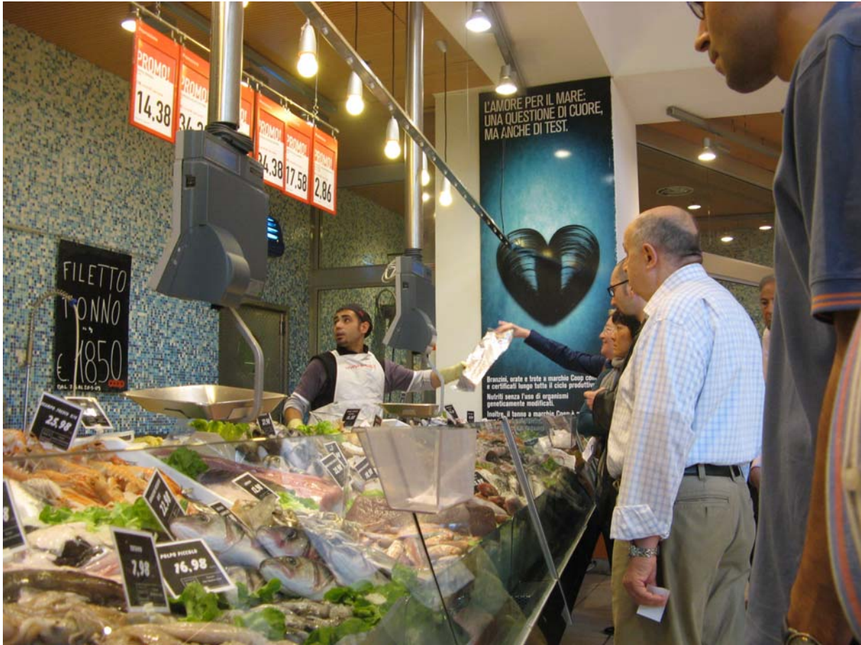
11. ábra: Kiszolgálás egy tengeri halakat és tenger gyümölcseit árusító boltban Olaszországban