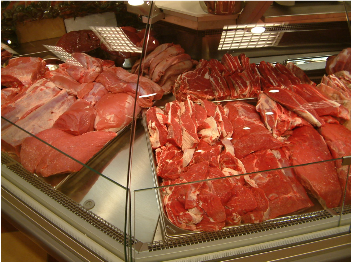
6. ábra: Sertés- és marhahús tárolása hűtőpultban

A hűtő- és fagyasztva tárolókat megfelelő, lehetőleg kalibrált hőmérővel kell ellátni, és hőmérsékletüket rendszeresen ellenőrizni kell. Dokumentálás a Hűtőterek léghőmérséklet ellenőrzési lapján történik. Soron kívüli hőmérséklet ellenőrzést kell végezni minden műszaki jellegű probléma (pl. áramszünet, hűtőberendezés műszaki hibája, stb.) esetén.