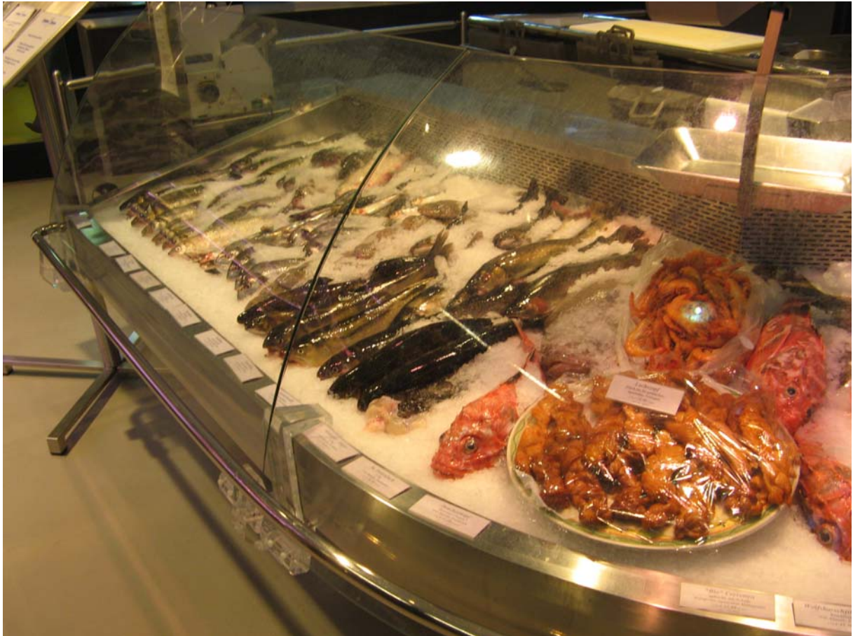
10. ábra: Halpult