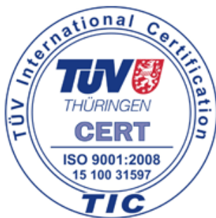
15.Ábra: A CORA ISO 9001-es minőségtanúsítványa

Az ISO 9001:2008 minőségirányítási rendszer újabb előrelépést jelent az egyre magasabb színvonalú komplex kiszolgálás terén, hiszen a Cora áruházakban nagy hangsúlyt fektetünk a vásárlói megelégedettségre, többek között a vásárlói reklamációk begyűjtésével és havi értékelésével. Az összefoglalások továbbgondolása révén olyan helyesbítő és megelőző intézkedések születnek, melyek a vásárlók érdekeit szolgálják.