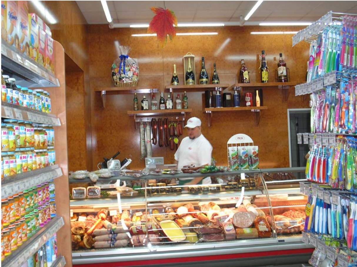
12. ábra: Húsfeldolgozó-ipari termékeket kiszolgáló eladó Budapesten

Megfelelő-e az eladók öltözéke ezeken a képeken? Indokolja választát!