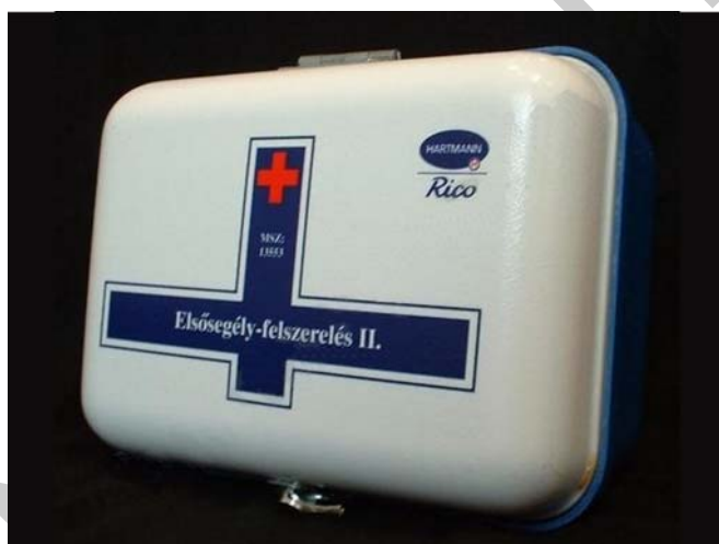
1. ábra. Munkahelyi elsősegély-felszerelés

Ez azt jelenti, hogy a dolgozók számával arányos mennyiségű és számú elsősegélynyújtó felszerelést kell elhelyezni a munkahelyeken hozzáférhető módon. A munkáltatónak ki kell jelölnie és ki kell képeznie (képeztetnie) elsősegélynyújtót a dolgozók közül, vagy a foglalkozás-egészségügyi szolgálat (korábbi elnevezéssel: üzemorvos) közreműködésével biztosítania kell képzett elsősegélynyújtó készenlétben állását.