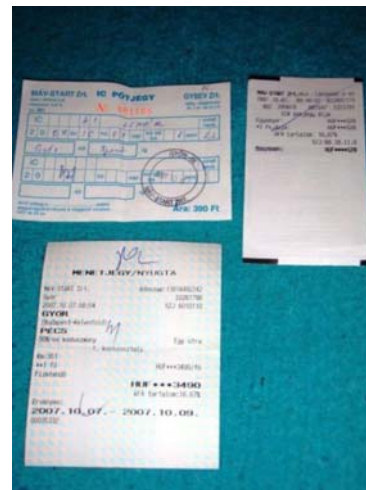
6. ábra: MÁV menetjegyek és IC póttjegy