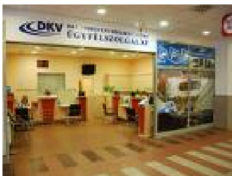
1. ábra: Ügyfélszolgálat

Egy menetrend szerinti személyszállítási tevékenységgel foglalkozó vállalat ügyfélszolgálatán vagyunk. Az ott dolgozók feladata, hogy az ügyfeleknek utazási ügyekben tanácsot adjanak, illetve menetjegyet, bérletet értékesítsenek. Az ügyfélszolgálaton jelentkezik egy 60 éves nyugdíjas hölgy, aki egy belföldi autóbusszjáráttal kíván utazni a 66 éves férjével és a 15 éves középiskolában tanuló unokájával együtt. Tájékoztatást kér az ügyfélszolgálati dolgozótól, hogy milyen utazási kedvezményeket vehetnek igénybe a menetjegy megváltásakor és a kedvezmények igénybevételéhez milyen dokumentumokkal kell rendelkezniük.