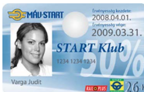
7. ábra Start-kártya