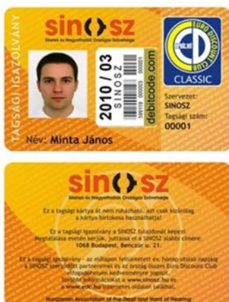
4. ábra: Siketek és Nagyothallók igazolványa