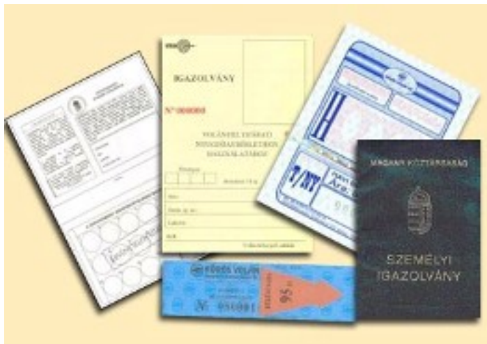
3. ábra: Nyugdíjasok igazolványai