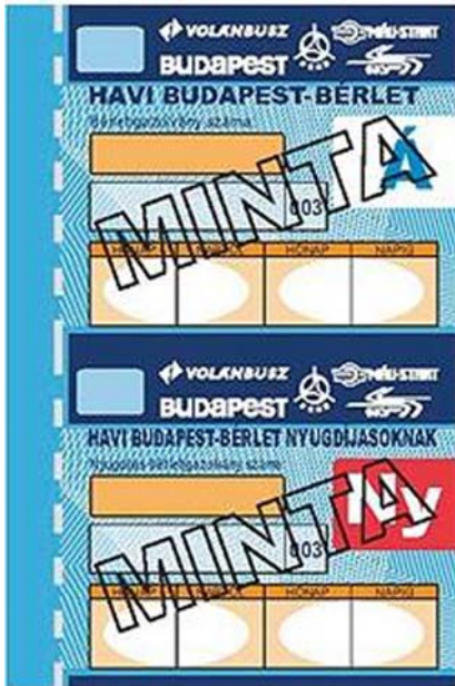
5. ábra Bérletszelvények

A kiadott menetjegyek és bérletszelvények: