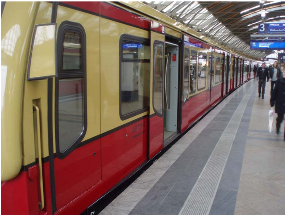
1. ábra. Die U-Bahn 1

Sie sehen auf dem Foto eine U-Bahnstation. Denken Sie darüber nach, warum viele Menschen gern mit der U-Bahn fahren. Was für Fahrkartentypen kennen Sie, mit der man mit den öffentlichen Verkehrsmitteln fahren kann?