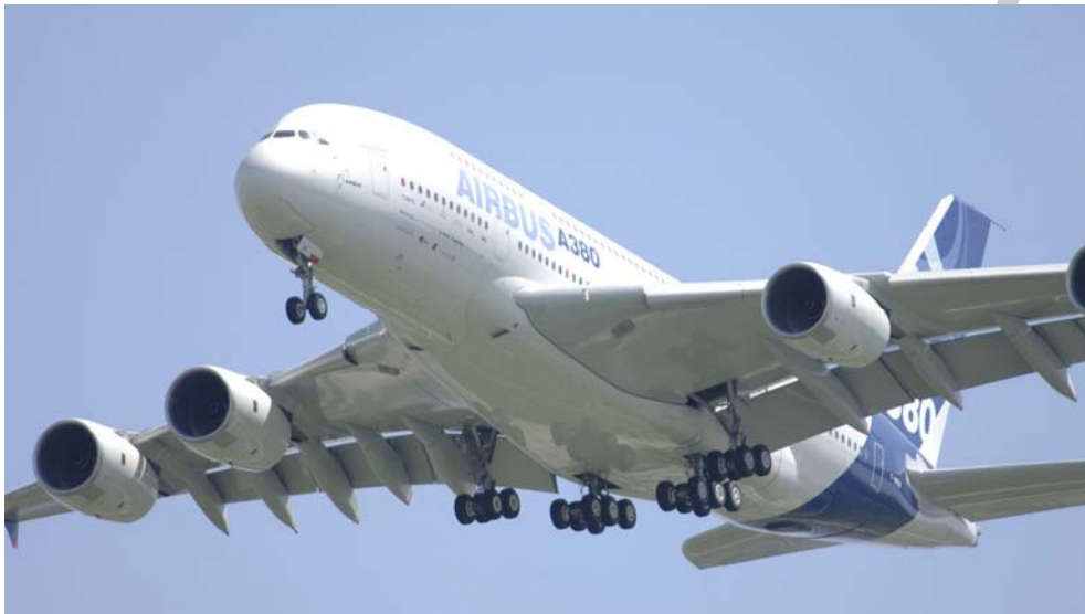
3. ábra. Ein Flugzeug 3

Sind Sie schon mit dem Flugzeug geflogen, wenn ja, wohin. Was alles braucht man für einen Flugverkehr? Sprechen Sie darüber in der Gruppe und machen Sie Notizen!