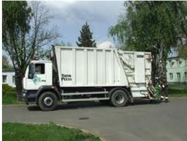
6. ábra. Hulladék szállítása 9

Az ilyen gyűjtőhelyeket családi házak, társasházak udvarán, emeletes házaknál a lépcsőházakban, szeméttárolókban, kapu alatt alakítják ki. Először általában két-három féle hulladékot gyűjtenek külön (szerves-komposztálható, papír, vegyes hulladékok). A gyűjtőedények számát fokozatosan lehet növelni újabb hulladék fajták gyűjtésére (műanyag, papír, fém).