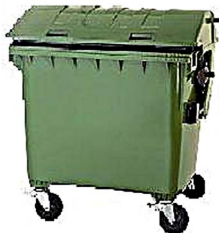
5. ábra. Hulladékgyűjtő kukák 8