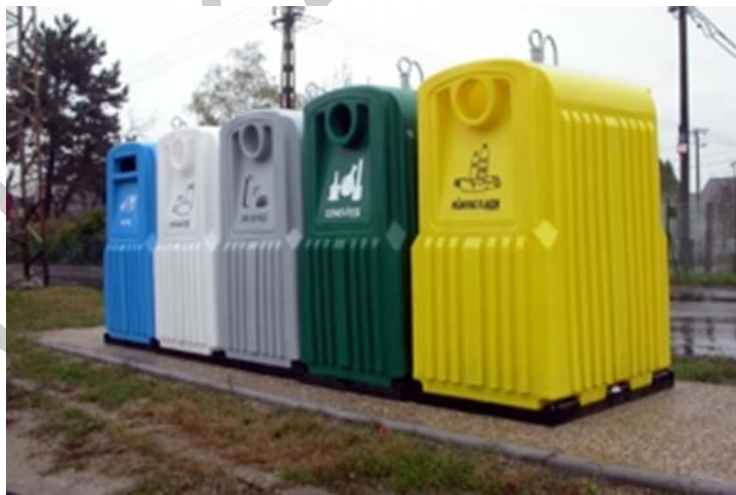
8. ábra. Szelektív hulladékgyűjtő sziget 11

Szelektív hulladékgyűjtés Magyarországon nagyon sok település, több ezer gyűjtőszigeten folyik, így több millió embernek van lehetősége a hulladékok különválogatására. A gyűjthető hulladékok településenként változnak, érdemes figyelni a gyűjtőkön elhelyezett matricákat, amelyek lehetnek sárga, kék, fehér, zöld és szürke színűek.