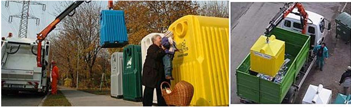
9. ábra. Szelektív hulladék szállítása 12

A szelektív hulladékgyűjtő szigeteknél a konténerek színe, a felirata vagy piktogramja tájékoztat az abban gyűjthető hulladékfajtáról. A sárga hulladékgyűjtő konténerbe a műanyagot, a kék hulladékgyűjtő konténerbe a papírt, a fehér hulladékgyűjtő konténerbe az üveget, a zöld hulladékgyűjtő konténerbe a színes üveget, a szürke hulladékgyűjtő konténerbe a fém dobozt kell gyűjteni.