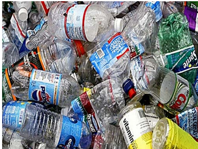
1. ábra. Hulladék 3

A hulladék kategóriába tartoznak még az elromlott, hibás tárgyak, az elrontott, selejt termékek is, amelyeket az emberek közvetlen környezetükből eltávolítanak, kidobnak.