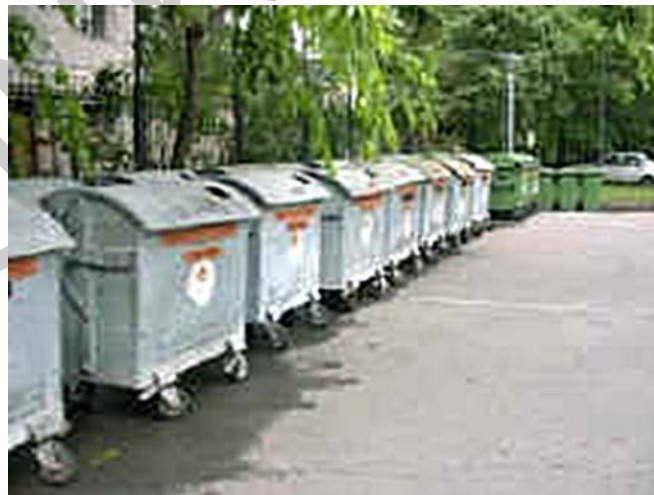
10. ábra. Hulladékudvar 13

A szelektív gyűjtési módszerek kiegészítőjeként alkalmazzák hulladékudvarokat. A hulladékudvarok olyan a hulladékokat fogadnak be, amelyek a háztartási gyűjtőedényekben (kukákban) nem helyezhetők el, illetve azokra, melyeket a lomtalanítás során sem szállítanak el. Így az elkülönítve gyűjtött másodnyersanyagokon kívül itt lehet leadni a nagydarabos hulladékokat (lomokat), kisebb, a lakások bontásánál, átalakításánál keletkező építési hulladékokat, és a háztartási veszélyes hulladékokat. Csak lakossági hulladékokat fogadnak.