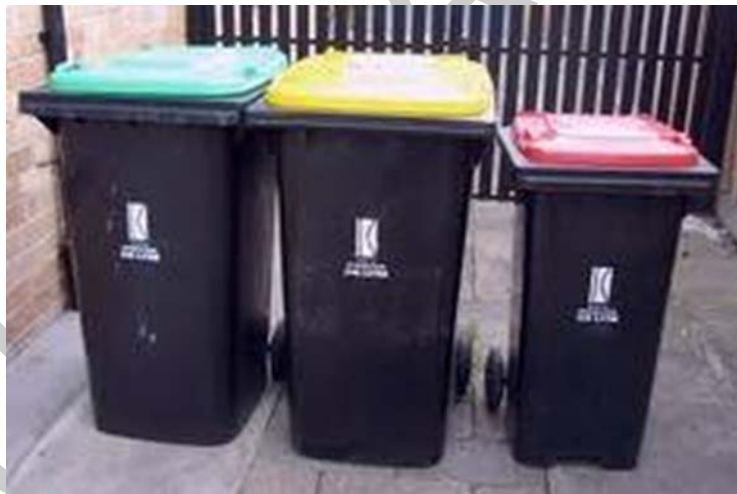
7. ábra. Hulladékgyűjtő edények 10

Az ilyen gyűjtőhelyeket családi házak, társasházak udvarán, emeletes házaknál a lépcsőházakban, szeméttárolókban, kapu alatt alakítják ki. Először általában két-három féle hulladékot gyűjtenek külön (szerves-komposztálható, papír, vegyes hulladékok). A gyűjtőedények számát fokozatosan lehet növelni újabb hulladék fajták gyűjtésére (műanyag, papír, fém).