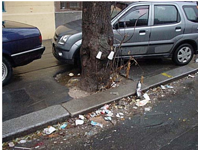
2. ábra. Szemét 5

Szemét az olyan haszontalanná vált és vegyesen tárolt, szétszórt anyagok, holmik, amiket tulajdonosa nem tud, vagy nem akar tovább használni, felhasználni. A szemét minden olyan anyag és energia, amit a "használd és dobd el" gondolkodásmód alapján annak ítélünk meg.