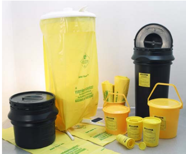
11. ábra. Veszélyes hulladékgyűjtők 14