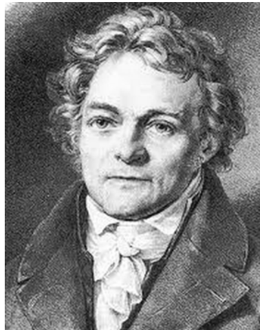
1. ábra. Alois Senefelder 1

A modern ofszet nyomtatás az Alois Senefelder által 1796-ban feltalált litográfiának a továbbfejlesztése. Senefelder találmánya az olaj és a víz kölcsönös taszításának elvén működik. A litográfiai kő alapanyaga a bajorországi Solnhofen környékén bányászott pala volt. Erre a simára csiszolt lapra speciális koromból és zsírból készült litográfiai krétával vagy tussal rajzoltak. A litográfiai eljárásban a kőre rajzoló művésznak tükörfordított nyomóformát kellett előállítania. Ez volt a kőrajz. Azért, hogy a zsíros tussal vagy krétával rajzolt vonalak ne legyenek elmosódottak, a kőlap felületét salétromsavval kezelték. Ennek nyomán a kő pórusai összeszűkültek, a víz nem szívargott be a kapillárisokba, hanem a kő felületén maradt. A rajzra nyomdafestéket vittek fel, ami a zsíros (vagy olajos) felületen megtapadt, a kőlap vízzel benedvesített részein viszont nem, így az odakerült festék egyszerű eljárással lemosható volt. A nyomtatásra szánt papírlapot az előkészített kőlapra helyezték, majd hozzápréselték. A nagy nyomásra az olajos részek átadták a festéket és így jött létre a kőnyomat, a litográfia .