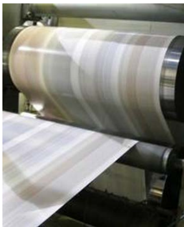
7. ábra. Ofszet tekercsnyomógép 7

A tekercsnyomógépek fő jellemzője a nagy sebesség, egyes gépek sebessége elérheti a 90.000 fordulat/óra értéket. A nagy fordulatszám azért lehetséges, mert az alkatrészek dinamikailag kiegyensúlyozott forgómozgást végeznek, és a papír is egyenletes sebességgel halad a gépben. Nem szükséges a papírt az illesztéshez lelassítani vagy megállítani, mint az ívnyomógépek esetében. A tekercsnyomógépeken elsősorban sajtótermékek (napilapok, folyóiratok) készülnek, de nyomtatnak rajtuk könyvbélveket is. A tekercsnyomógépek általában nem csak a nyomtatást végzik, hanem a továbbfeldolgozás műveleteit is: hajtogatást hossz- és keresztirányban, keresztvágást, esetleg drótfűzést. A tekercsnyomógépek beszerzési költsége és helyigénye jóval nagyobb az íves gépeknél, viszont olcsóbb tekercspapírra nyomtatnak, és a nagy fordulatszámuk miatt gazdaságosan üzemeltethetők magasabb példányszámú munkák esetén.