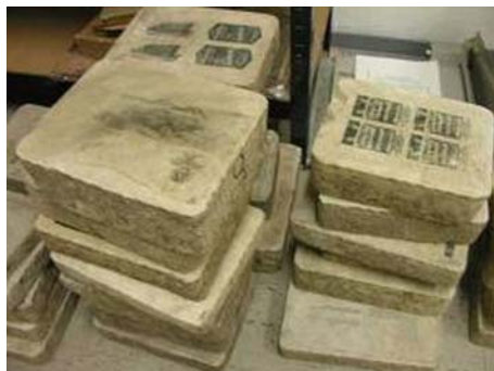
2. ábra. Kőlapok 2

Az évek során a kőlapokat hajlítható fémlemezre, mindenekelőtt cinklemezekre cserélték nyomóformaként. A konzervdobozok nyomtatásánál azonban előállt az a probléma, hogy a cinklemezzel fémre, kemény a keményre nem lehetett nyomtatni. A probléma megoldásaként egy rugalmas gumihengert iktattak be. Ezáltal létrejött a közvetett síknyomtatás, mely elvet később az ofszet nyomógépekben is alkalmazták.