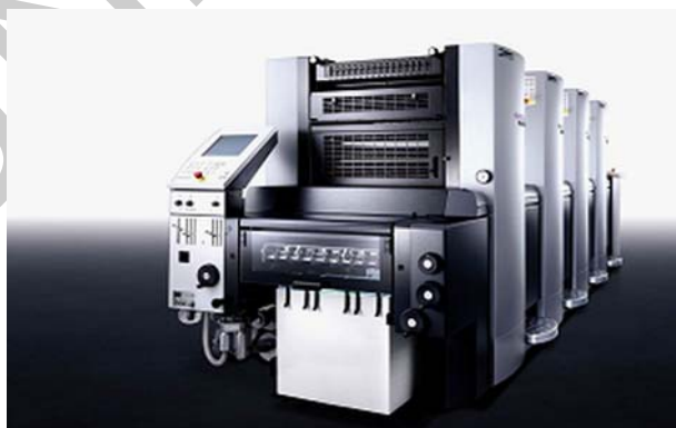
6. ábra. Négyszínnyomó íves ofszet nyomógép 6

A nyomdagépek közül a legelterjedtebbek az ívnyomógépek. Az ívnyomógépeken készült nyomatok az igényes minőségi követelményeket is kielégítik. A nyomtatás sebessége elérheti a 20.000 fordulat/órát is. A jellemző legnagyobb és legkisebb formátum határain belül tetszőleges méretű papírra lehet nyomtatni. Az ívnyomógépekkel készülhetnek akcidens kiadványok, plakátok, prospektusok, könyvek, folyóiratok, vagyis a névjegyektől az óriásplakátokig minden, ami papírra, kartonra nyomtatható.