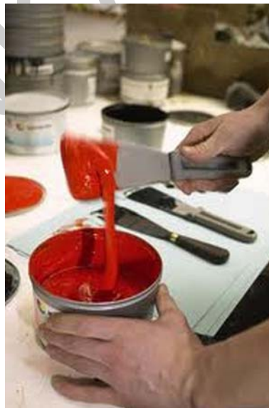
5. ábra. Íves ofszet nyomdafesték 5

Az ofszet nyomdafestékek fejlesztésénél a színek intenzitásának növelésére törekedtek úgy, hogy közben a festék nyomtathatósági tulajdonságai ne változzanak hátrányosan. A nagyobb pigment-töménység mellett is olyannak kellett maradnia a festékek konzisztenciájának, hogy azok a dobozból kivéve minden segédanyag nélkül nyomtathatók legyenek. Ezért a korábbi nehéz szerves pigmenteket felváltották a nagy színintenzitású valódi szerves pigmentek. A színtelen pigmenthordozók mennyiségét lényegesen csökkentették, vagy teljesen megszüntették.