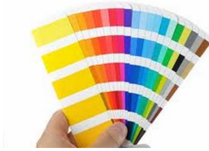
4. ábra. Pantone színskála 4

A nyomtatási folyamatban a nyomdafesték először a festékvályúba, majd pontos adagolásban a nyomóformára kerül. Fontos követelmény, hogy a nyomdafesték a festékvályúban ne álljon meg, hanem folyamatosan a nyalóhengeren, a továbbító-, dörzs- és festékfelhordó hengereken keresztül a nyomóformán egyenletes, tiszta festékfilm-réteget hozzon létre. A nyomóformáról a gumikendőn keresztül a festék kívánt mennyiségben a nyomathordozóra kerül, majd megkezdődik a festékszáradás.