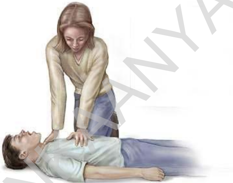
5. ábra Segítségnyújtás

A helyszín biztosítása további intézkedés (a baleset kivizsgálása) lefolytatásához.