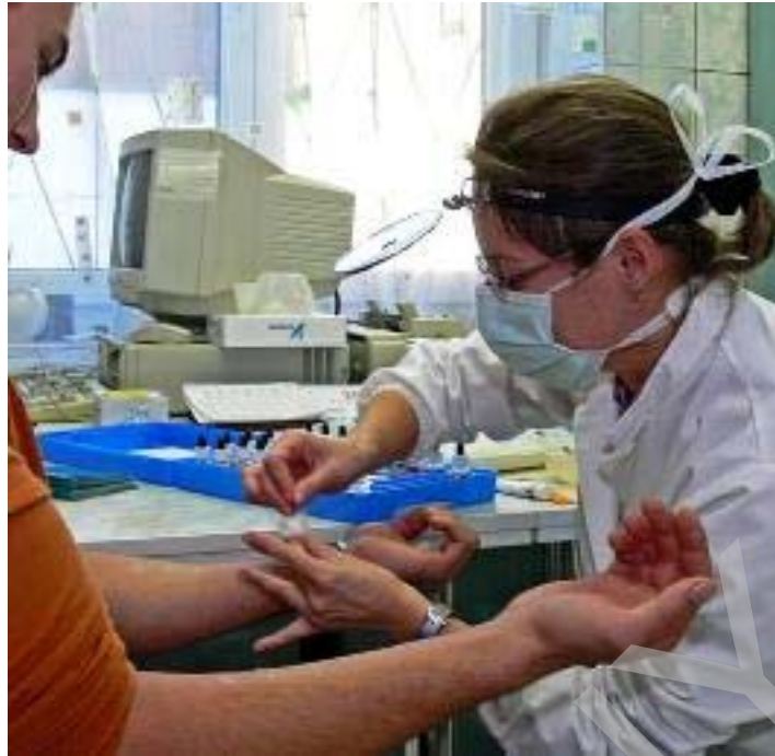
3. ábra Orvosi vizsgálat

Az a munkavállaló, aki nem vesz részt az alkalmassági vizsgálaton, vagy alkalmatlan minősítést kap, az adott munkakörben nem foglalkoztatható.