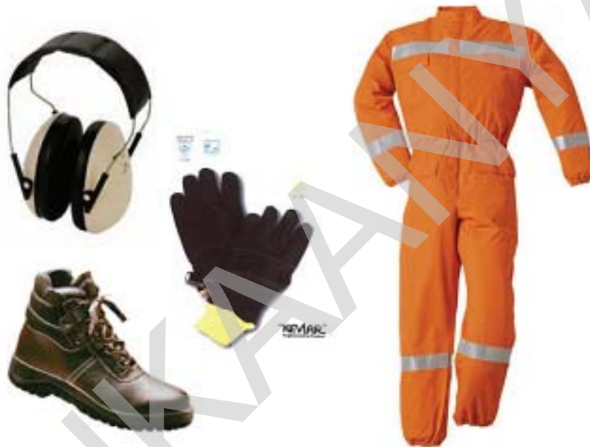
2. ábra. Egyéni védőeszközök

A munkabalesetek megelőzése érdekében meg kell határozni, hogy az adott tevékenységet milyen környezeti feltételek megléte, milyen munkaeszközök és technológiák alkalmazása, milyen védőberendezések, valamint egyéni védőeszközök használatával lehet végezni, így kizárható, hogy a munkát végző a veszélyforrás hatókörébe kerüljön.