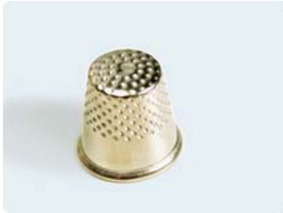
4. ábra Gyűszű

A biztonságos és egészséges munkavégzés követelményeit elsősorban műszaki, szervezési eszközökkel kell kielégíteni. Úgy kell kialakítani a technológiát és olyan munkaeszközöket kell használni, hogy balesetveszélyt ne jelentsenek.